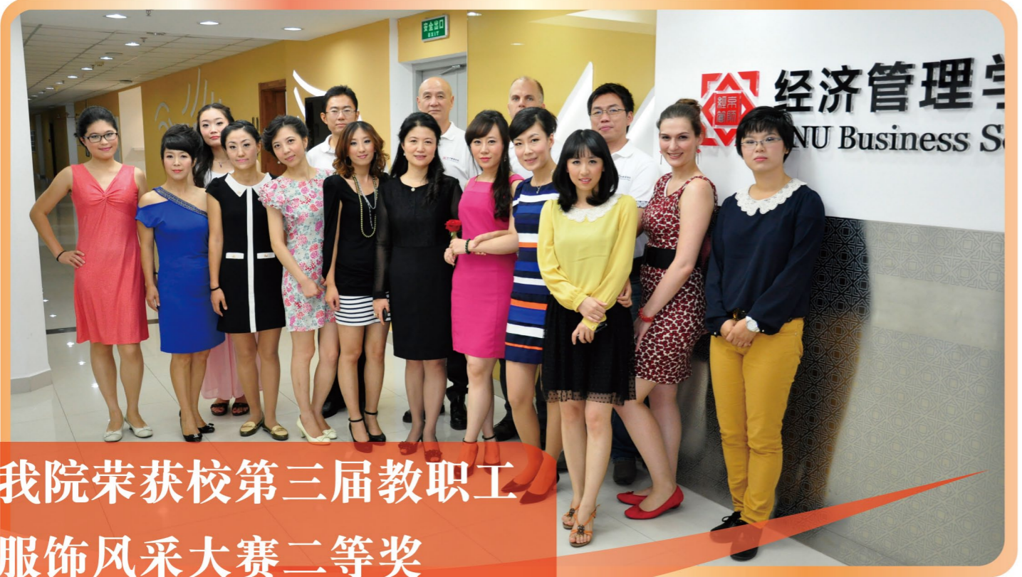
我院荣获校第三届教职工服饰风采大赛二等奖